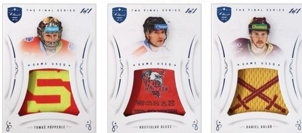
The Final Series Game Used Jersey